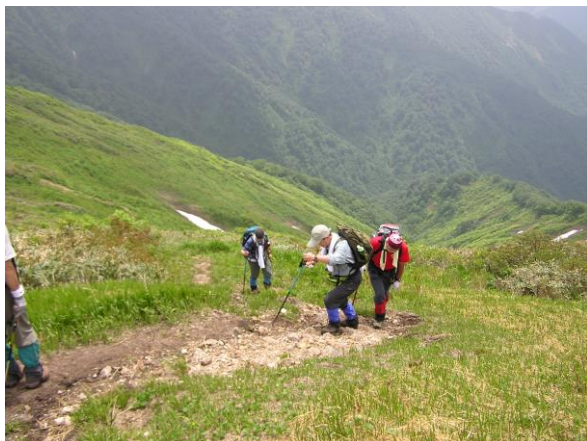
小又山の最後の急登

小又山へ直登できるのは、最上町の西の又口から（230分）と大又口から（220分）です。どちらも6合目の越途までは距離が長く、急登もあるので大変ですが、6合目からは峰歩きとなり、右手に虎毛山や神室山、左手に火打岳を見ながら60分で山頂へ行けます。9合目先の草付きの急登りを登り切れば、開けた草付きの山頂です。（○合目の表示有）