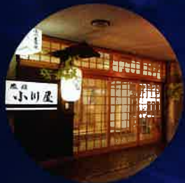
各旅館にて特別割引