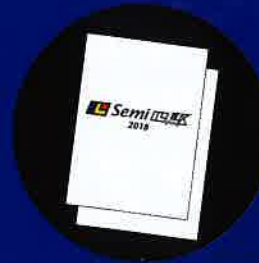
豪華景品が当たるスタンプラリー付 プログラム無料