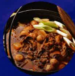
イベントで使える お食事券プレゼント