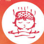
もがみ温泉郷 イメージキャラクター とっぷりちゃん