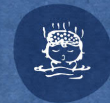
赤倉温泉観光協会